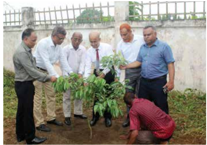
পরিবেশ সুরক্ষায় খনি এলাকায় বৃক্ষ রোপণ কর্মসৃচি

খনি এলাকার সুষ্ঠু পরিবেশ সংরক্ষণের জন্য কোম্পানির পক্ষ হতে বিভিন্ন পদক্ষেপ গ্রহণ করা হয়ে থাকে। ক্রাশিং ও সর্টিং প্লান্টে এবং ক্ষিপ আনলোডিং হাউজে সৃষ্ট শিলাধূলি থেকে রক্ষা পাওয়ার জন্য প্রয়োজনীয় ডাস্ট কালেক্টর স্থাপন করা আছে। ভূ-উপরিভাগে যেসব যন্ত্রপাতি ব্যবহার করা হচ্ছে তা হতে উদ্ভূত শব্দ অনুমোদিত মাত্রা ৭৫ ডেসিবল-এর মধ্যে রয়েছে। ফলে অত্র খনি কাজে সংশ্লিষ্ট জনবল ও পরিবেশের উপর উদ্ভূত শব্দের কোন বিরূপ প্রতিক্রিয়া নেই। পরিবেশ সুরক্ষার জন্য খনি এবং আবাসিক এলাকায় বিভিন্ন ফলজ, বনজ ও ঔষধি জাতের গাছের চারা রোপণ করা হয়েছে। কৃক্ষ রোপণ কার্যক্রম অব্যাহত আছে এবং রোপণকৃত গাছের নিয়মিত পরিচর্যা করা হচ্ছে।