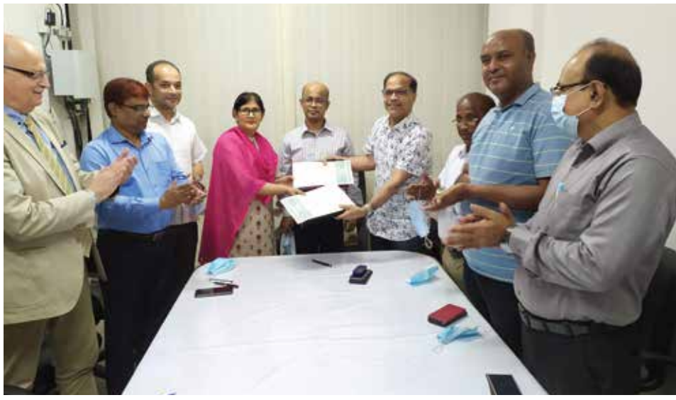
▶ New contract signed with GTC

A contract was signed between Maddhapara Granite Mining Company Limited (MGMCL) and Germania-Trest Consortium (GTC) captioned "EPC of New Equipment, Extraction and Production of Rocks/Stones, Supply, Installation Commissioning of Equipment, Supply of Spare Parts, Consumables, Materials and the Like, Care and Maintenance, Repair and Overhauling of Plants and Installation of Equipment of the and Keeping Mine up of Maddhapara Granite Mine" for a period of six (6) years (Contract No. MGMCL/GTC/ROCK/2021-27) and