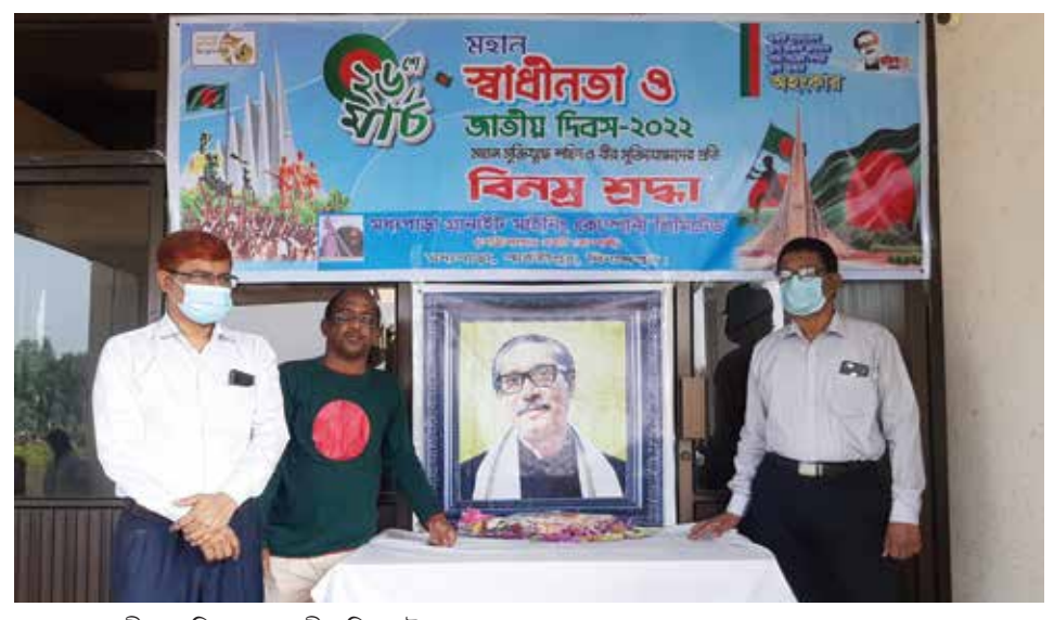
মহান স্বাধীনতা দিবস ও জাতীয় দিবস উদ্যাপন