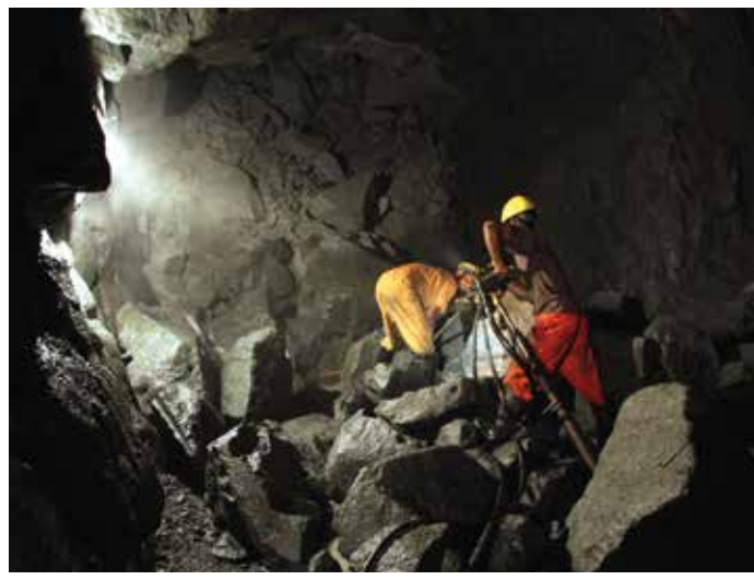
গ্রানাইট পাথর উৎপাদনের জন্য প্রয়োজনীয় দ্রিলিং কার্যক্রম