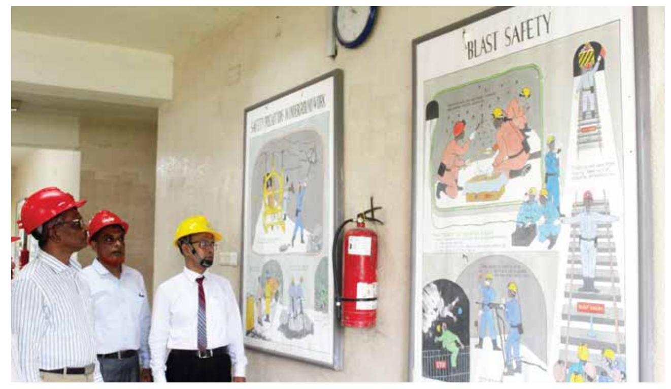
▶ ভূ-গর্ভয়্ব কাজের জন্য প্রয়োজনীয় সেফটি নির্দেশনা

ভূ-অভ্যন্তরে প্রবেশের পূর্বে খনি কর্মীদের স্বাস্থ্য পরীক্ষা করা হয়। ভূ-অভ্যন্তরে প্রবেশকালে ব্যক্তিগত সুরক্ষার জন্য মাথায় হেলমেট, পায়ে গামবুট, হেডল্যাম্প ও এয়ার প্রটেক্টর ব্যবহার করা হয়ে থাকে। ২০২১-২০২২ অর্থবছরে খনিতে উল্লেখযোগ্য কোন দুর্ঘটনা ঘটেনি।