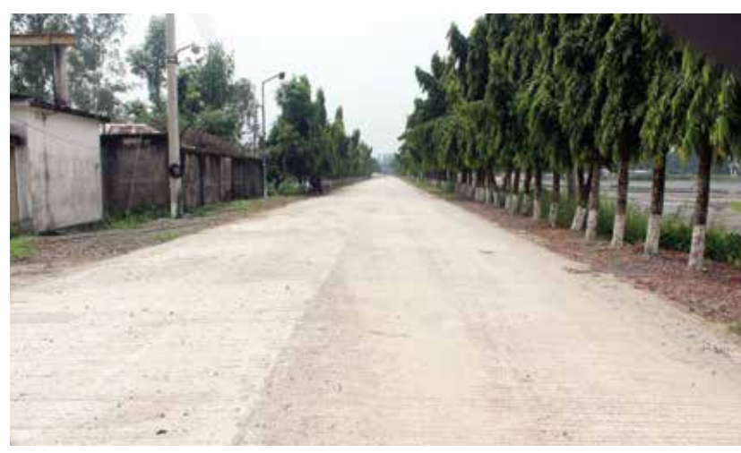
এমজিএমসিএল এর নির্মিত নতুন রাস্তা