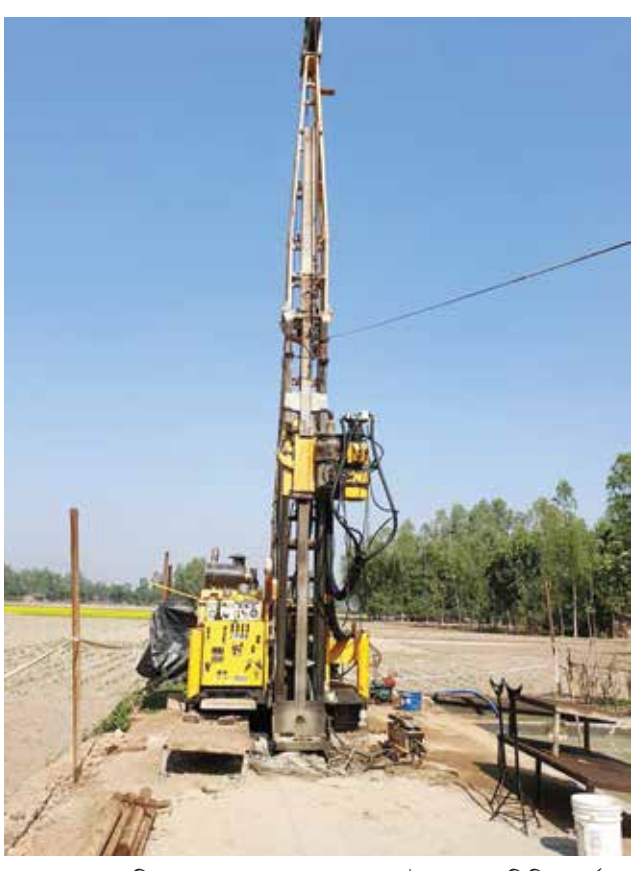
মধ্যপাড়া খনির ২য় ফেজ এর সম্ভাব্যতা যাচাই প্রকল্পের দ্রিলিং কার্যক্রম।