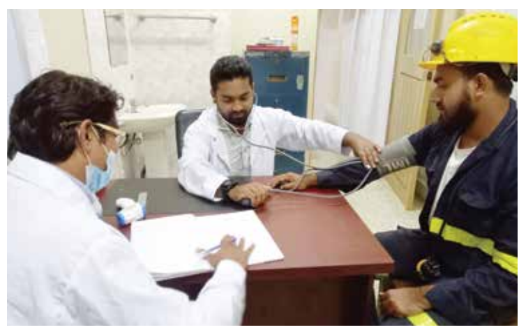
জিটিসি'র চিকিৎসক কর্তৃক খনি কর্মীদের নিয়মিত স্বাস্থ্য পরীক্ষা

সু-স্বাস্থ্য ও স্বাস্থ্যকর কর্মপরিবেশ কর্মকর্তা ও কর্মচারীদের কর্মদক্ষতা বৃদ্ধিতে প্রত্যক্ষ ভূমিকা রাখে, তাই খনিতে কর্মরত সকল কর্মকর্তা, কর্মচারীর নিয়মিত স্বাস্থ্য পরীক্ষা করা হয়ে থাকে। খনিতে সংঘটিত দুর্ঘটনার জন্য খনির অভ্যন্তরে ও উপরিভাগে প্রাথমিক চিকিৎসা সেবা প্রদানের সুব্যবস্থা রয়েছে। জরুরী প্রয়োজনে রোগীকে উন্নত চিকিৎসার জন্য রংপুর/দিনাজপুর-এ এ্যামুলেন্সযোগে প্রেরণ করা হয়ে থাকে। স্বাস্থ্য সেবা প্রদানের জন্য কোম্পানির অধীনে বর্তমানে ১ জন সহকারী মেডিকেল কর্মকর্তা কর্মরত আছেন। পাশাপাশি খনিকর্মীদের স্বাষ্ট্যসেবা নিশ্চিত করার লক্ষ্যে ঠিকাদার প্রতিষ্ঠান জার্মানিয়া-ট্রেস্ট কনসোর্টিয়াম (জিটিসি) এর আওতায়