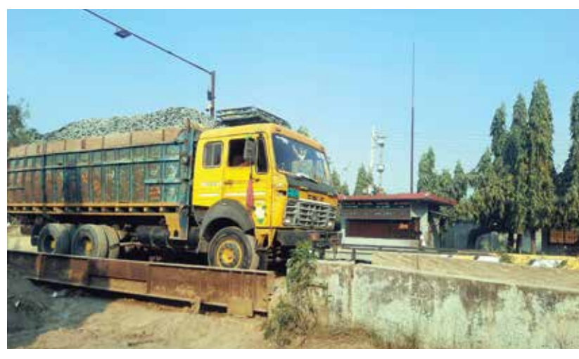
▶ গ্রানাইট পাথর সরবরাহ