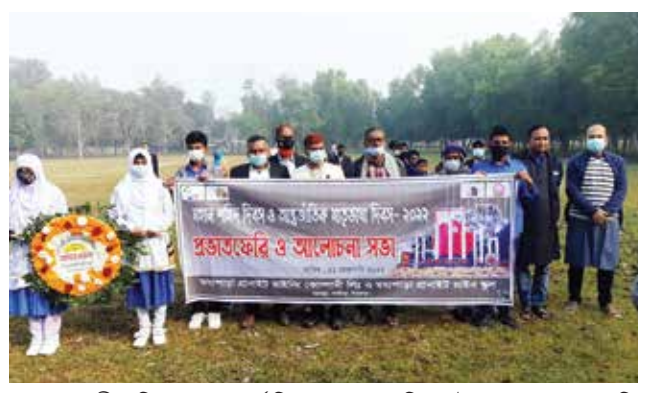
মহান শহীদ দিবস ও আন্তর্জাতিক মাতৃভাষা দিবস উপলক্ষে প্রভাতফেরি