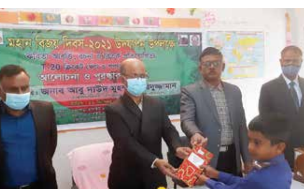
মহান বিজয় দিবস-২০২১ উপলক্ষে আয়োজিত কবিতা আবৃত্তি, রচনা ও চিত্রাংকন প্রতিযোগিতার পুরষ্কার বিতরণ