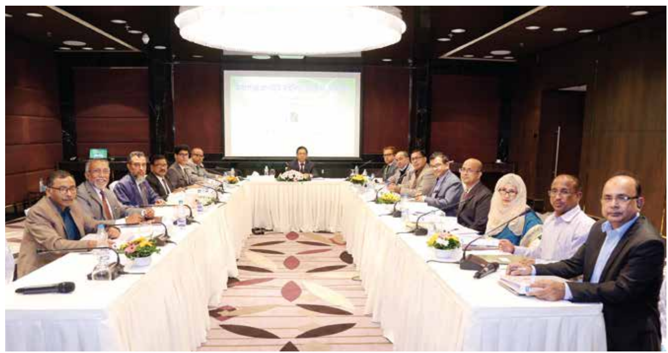
২৩তম বার্ষিক সাধারণ সভা

খনি উন্নয়ন ঠিকাদার "নামনাম" এর নিকট থেকে ২৫ জুলাই ২০০৭ তারিখে খনিটি এমজিএমসিএল কর্তৃক গ্রহণ করে নিজম্ব ব্যবস্থাপনায় নভেম্বর ২০১৩ পর্যন্ত এক শিফটে খনির উৎপাদন কার্যক্রম পরিচালনা করা হয়। দেশের ক্রমবর্ধমান ভৌত অবকাঠামো নির্মাণে পাথর ব্যবহার বৃদ্ধির প্রেক্ষিতে মধ্যপাড়া খনির পাথর উৎপাদন বৃদ্ধি করার প্রয়োজনীয়তা দেখা দেয়। এরই ধারাবাহিকতায় মধ্যপাড়া গ্রানাইট মাইনিং