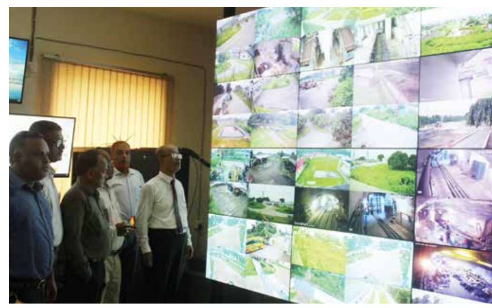
খনির ভূ-গর্ভস্থ ও ভূ-পৃষ্ঠস্থ নিরাপত্তা পর্যবেক্ষণ ও কার্যকর ব্যবস্থা গ্রহণ

এলাকায় নিরাপত্তা প্রহরীর পাশাপাশি খনি এলাকায় ৩৩টি, আবাসিক এলাকায় ১৯টি এবং এক্সপ্লোসিভ ম্যাগাজিনে ১০টি সহ সর্বমোট ৬২টি সিসি টিভি ক্যামেরা রয়েছে। এছাড়াও খনি এলাকায় ঠিকাদার জার্মানিয়া-ট্রেস্ট কনসোর্টিয়াম (জিটিসি) এর প্রায় ১০০টি সিসি টিভি ক্যামেরা রয়েছে। ২ জন কর্মকর্তার তত্ত্বাবধানে ৮০ জন আনসার, কোম্পানির নিজস্ব ৫ জন স্থায়ী নিরাপত্তা প্রহরী এবং আউট সোর্সিং এজেন্টের মাধ্যমে ১ জন নিরাপত্তা হাবিলদার, নিরাপত্তা প্রহরী ও ৩২ জন আরআরএফ (রেঞ্জ রিজার্ভ ফোর্স) সহ মোট ১৪৫ জন জনবল দ্বারা খনি এলাকা, বিস্ফোরক ম্যাগজিন, আবাসস্থল, এমজিএমসিএল-এর আবাসিক এলাকা ২৪ ঘণ্টা সশস্ত্র প্রহরার ব্যবস্থা করা হয়েছে। খনি এলাকার বাউন্ডারী ওয়াল কেপিআই নীতিমালা অনুযায়ী নির্মাণ করা হয়েছে। খনির প্রধান ফটকে সেইফটি গেট